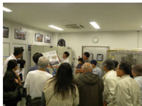
断層コア@サンプリング室