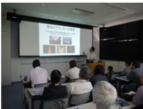
KCC 概要説明@セミナー室