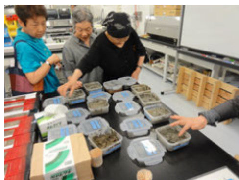
「世界の泥」@サンプリング室