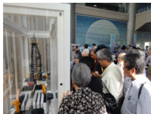
「ちきゅう」1/100 スケール模型@エントランス