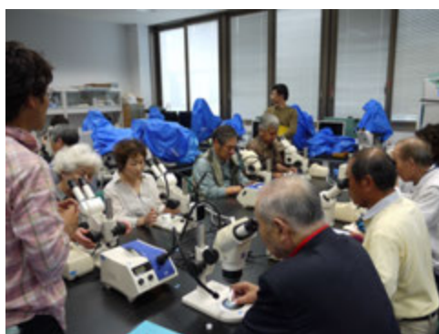
「世界の砂」観察@微化石画像処理室